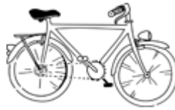
Objet 2 : un vélo