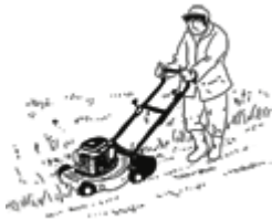
Objet 1 : une tondeuse