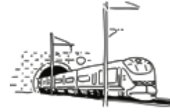
Objet 3 : un train