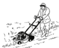
Objet 1 : une tondeuse

Observe les trois images et note le nom de l'objet que tu vois. Ensuite, note dans le tableau un souvenir personnel lié à chaque objet (les personnes, la situation, le lieu...)