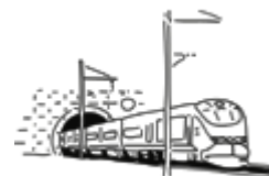
Objet 3 : un train