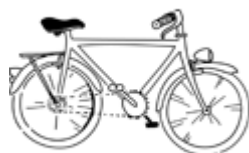
Objet 2 : un vélo